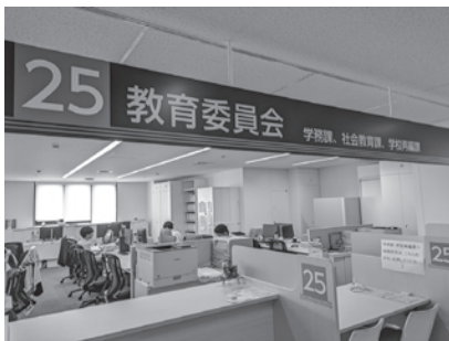
教育委員会の窓口

来年の3月末での教育長の退任に対しても次はどういった体制が良いのかを十分に勘案しながら、その上で私自身が任命していきます。