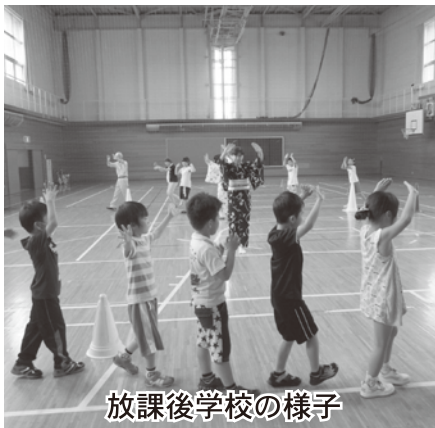
放課後学校の様子

活動内容は「ふれあい遊び」「地域の先生タイム」「四季タイム」「勉強・読書タイム」「スポーツ・レクタイム」の各プログラムがあり、地