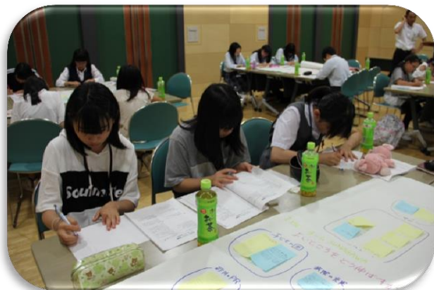
最後は作文を書きました