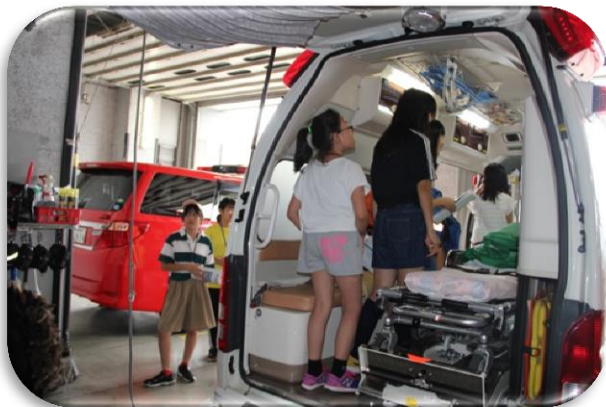
砂川地区広域消防組合