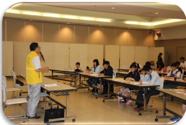
すながわスイートロードについて学習