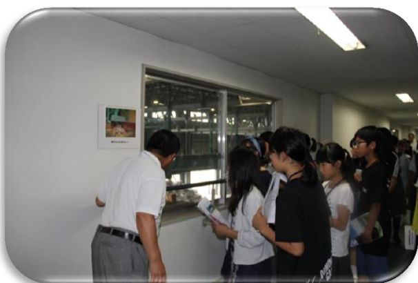
クリーンプラザくるくる