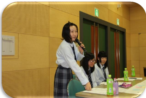
質疑応答も活発に行いました