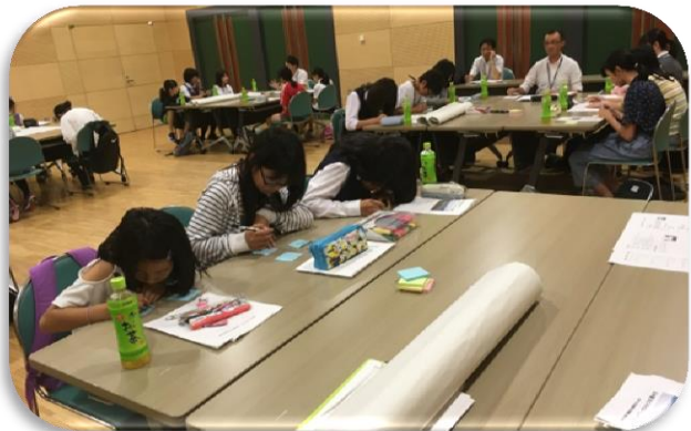
スイーツガールズ