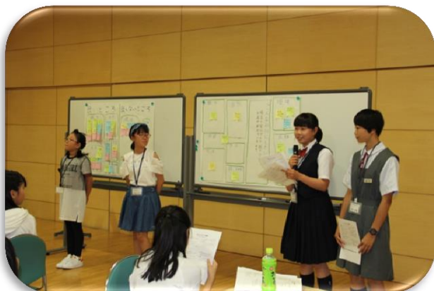
チームスイーツ発表