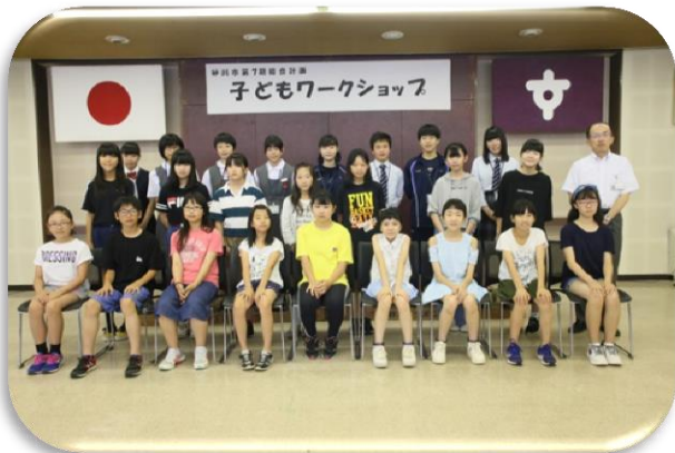
出発前にみんなで記念写真