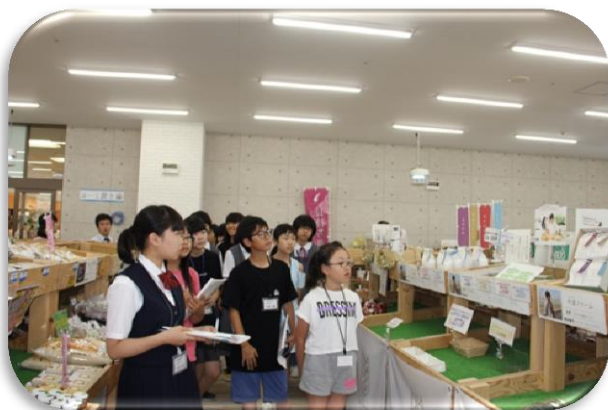
ハイウェイオアシス館内そらいちマーケット