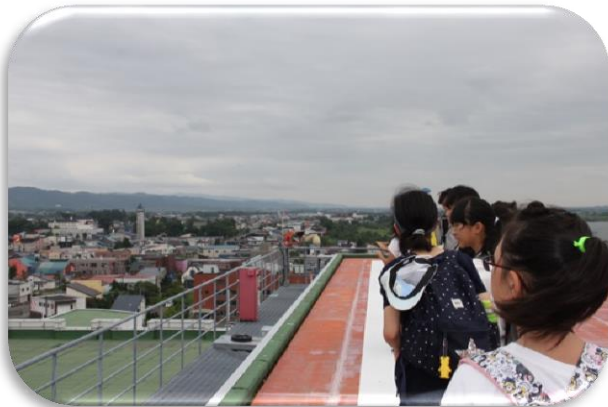
市立病院屋上で市内を一望