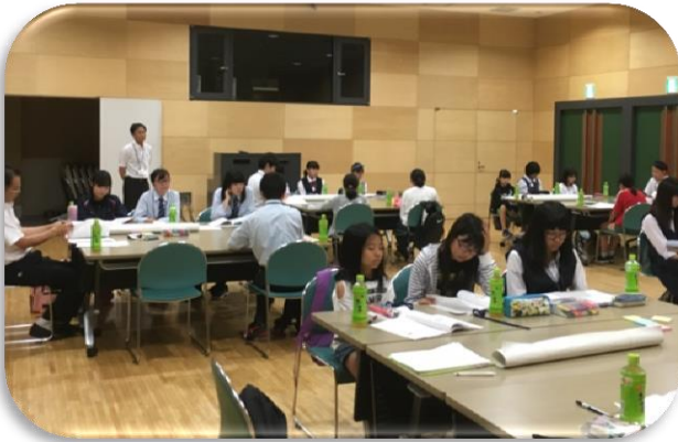
開始前で緊張の面持ち

～考えてみよう「砂川のよいところ、よくないところ」（グループディスカッション）～