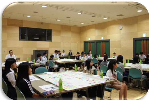
発表前にみんなでおさらい