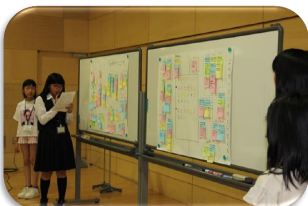
スイーツガールズ発表