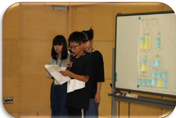
チーム SUNAGAWA 発表