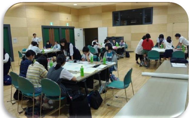
ディスカッションを進めます