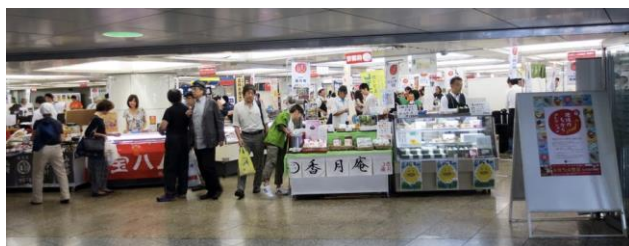
▲東京新宿販売会「ちいきのちからコレクション」