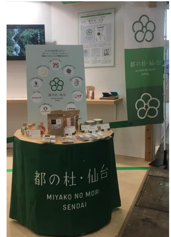
▼仙台市ブランド「都の杜・仙台」ロゴ・幟など