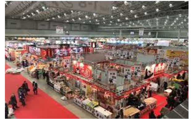
▲スーパーマーケット・トレードショー

BR(地域ブランドのテーマ確定・発表) | BR(展示・商談会、販売会、広報活動)