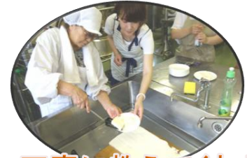
丁寧に教えてくれるので 初心者も安心！