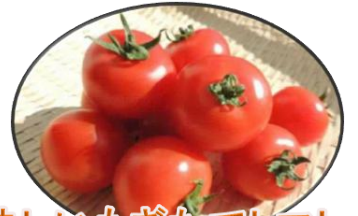
美味しいもぎたてトマト

地産地消。6次産業化。農商工連携。キーワードはたくさん。すながわの魅力をあなたのちからで発信しましょう。