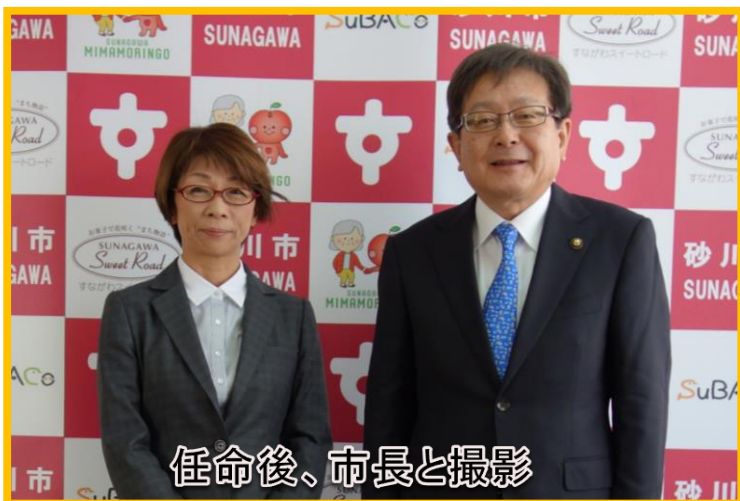
任命後、市長と撮影