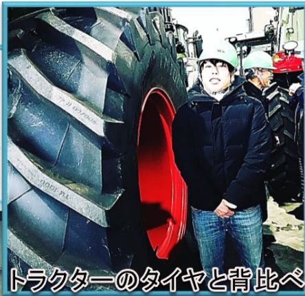
トラクターのタイヤと背比べ