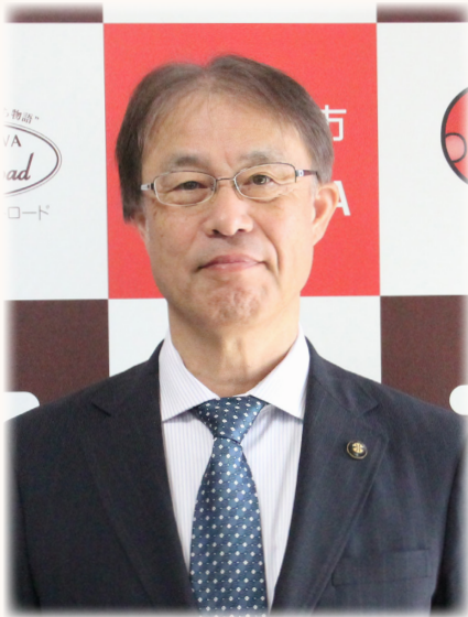
砂川市長 飯澤明彦

長引く物価高騰や円安の状況など、先が見通せない経済情勢の中、本市の財政運営につきまして、近年の大型建設事業により、今後は一定程度の公債費の増加が見込まれておりますが、安定的な歳入の確保と財政規律を遵守し、各事業の推進と財政健全化の両立を目指して市政運営に取り組んでまいります。