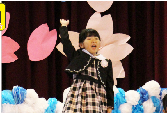
▲元気いっぱい手をあげて大きな声でお返事