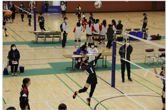
▼試合は一生懸命に、そして楽しく！

10月15日(土)、総合体育館にて、「第15回 すながわスイートロード杯バレーボール大会」 が開催され、砂川高校を含む8校が参加しまし た。本大会ならではの大会賞品は、砂川菓子 組合提供の砂川の人気スイーツ！試合はどの チームも笑顔で盛り上がっているのが印象的 な、親睦・交流の深まった交流大会となりました。