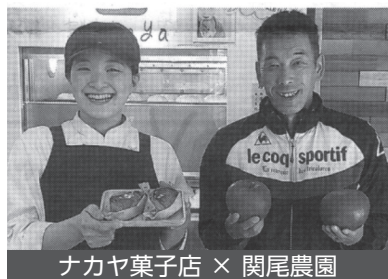
ナカヤ菓子店 × 関尾農園

メンバーの連携による商品やサービス、雇用などが生み出され、商品は市内店舗やイベント、ふるさと納税、ネット通販にて販売されています。主な連携商品についてご紹介します。