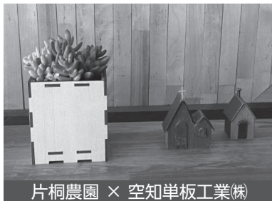
片桐農園 × 空知単板工業株