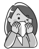
ハンカチティッシュを使う