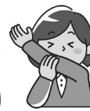
袖・腕で口をおおう