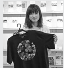
これが○T Art です