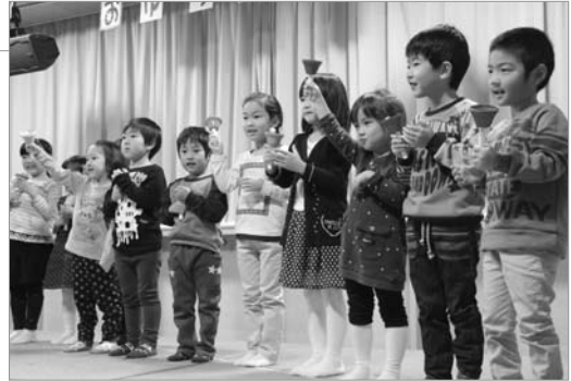
●ミュージックベルを披露!!

おゆうぎかいが行われ、子どもたちが元気いっぱい歌や踊り、劇などを披露しました。年少の子どもたちは大勢の前で緊張してしまう場面もありましたが、年中・年長になるにつれ、堂々と演目を披露していました。一生懸命頑張る子どもたちの姿にお父さん、お母さんたちは大きな拍手を送っていました。