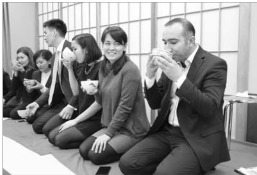
●初めての茶道を体験しました

JICA(独国際協力機構)が開発途上国の方を対象に行っている青年研修で砂川を訪れました。日本の技術や制度、文化などを学び、将来の国づくりを担う人材育成を目的に行われている事業で、市内では、(株)ホリとソメスサドル(株)の工場見学、地域交流センターゆうで茶道の体験を行い、産業や観光、歴史などを学びました。