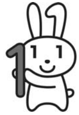
マイナンバー 広報キャラクター マイナちゃん

10月から送付を開始しているマイナンバーの通知カードは「再配達期間を過ぎた」「郵便局に転送届を出している」等の理由で、通知カードを受け取ることができなかった場合、市役所に返戻され、3か月間程度保管されます。