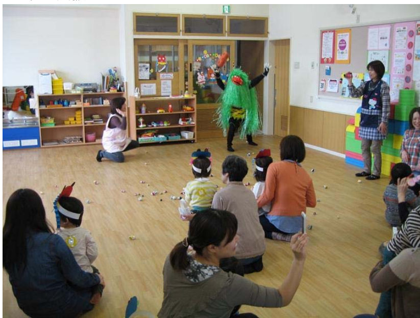
子育て支援センター