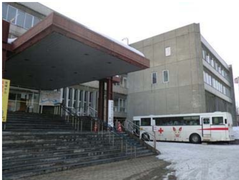
砂川市役所では43名の方に献血のご協力をいただきました