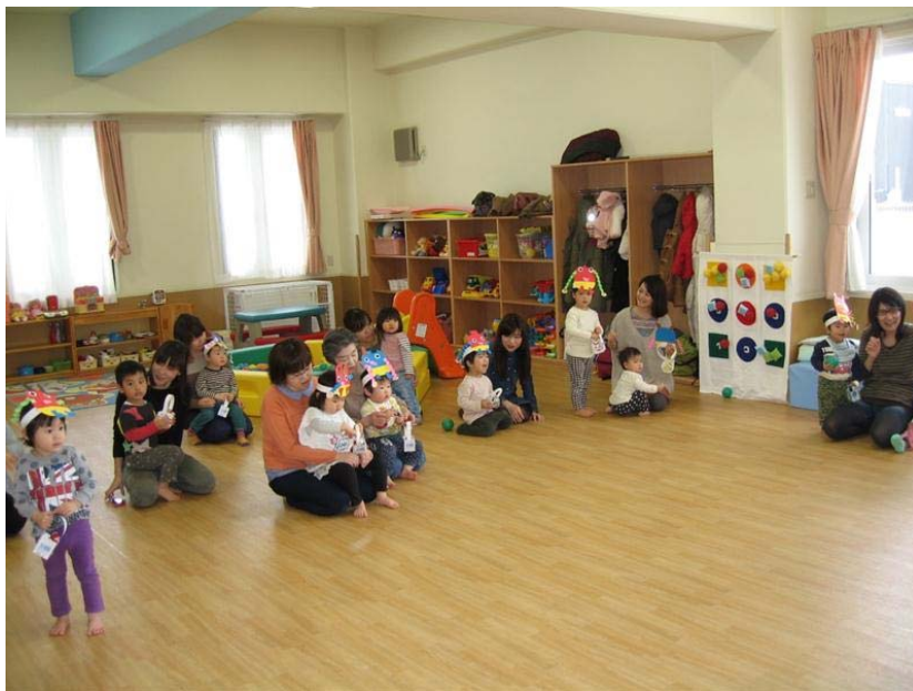
子育て支援センター